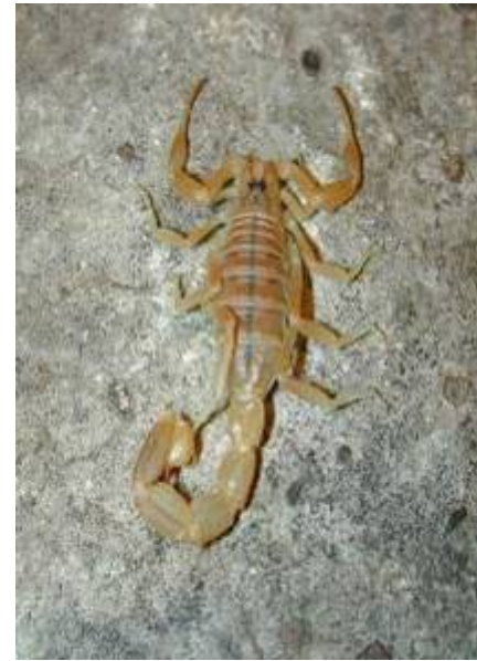
Le Scorpion blanc du midi