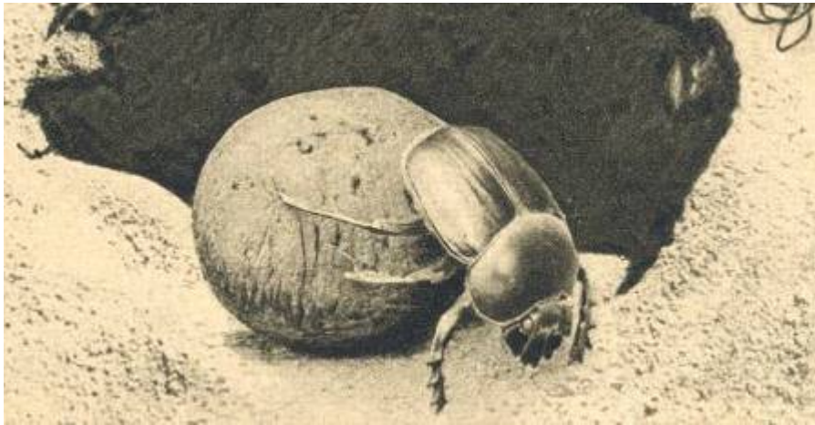
Le Scarabée sacré progresse à reculons avec sa boule

Les insectes sont des arthropodes (animaux à pattes articulées) à six pattes. Les arthropodes qui ont plus de six pattes, comme le scorpion ou les araignées, ne sont pas des insectes